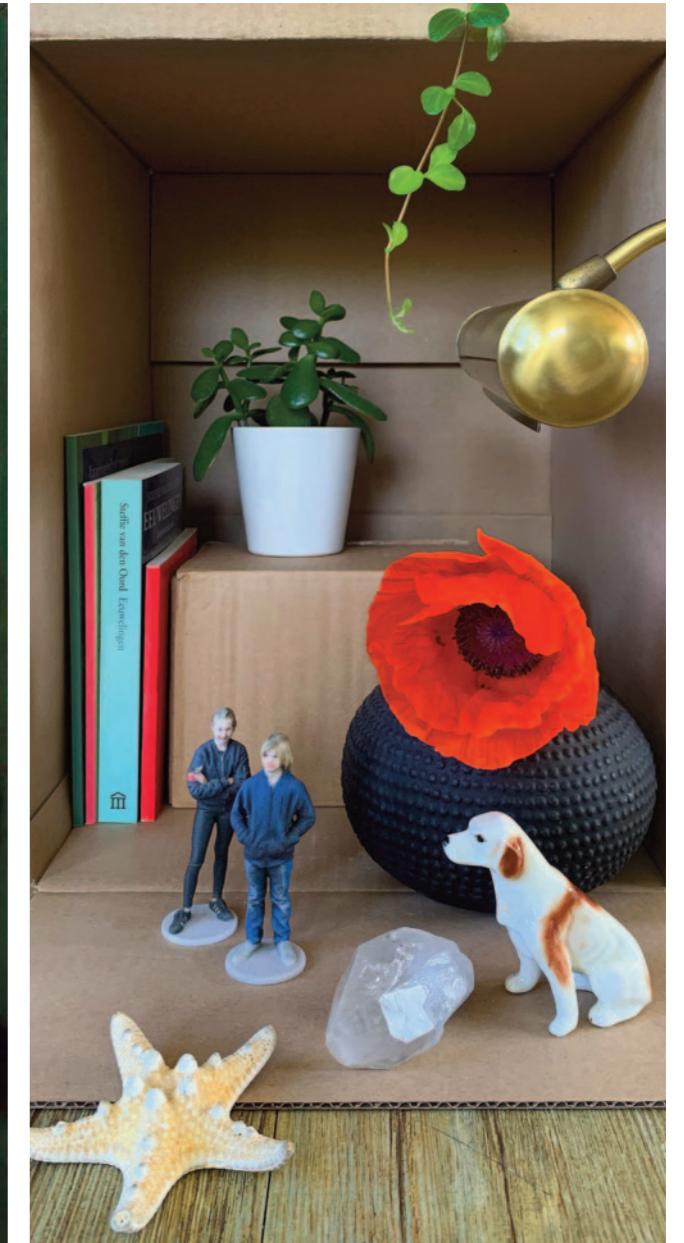
Links het stilleven Old Models van schilder William Michael Harnett uit 1892. Olieverf op doek, Boston, Museum of Fine Arts. Rechts een nieuw stilleven gemaakt met alledaagse voorwerpen.